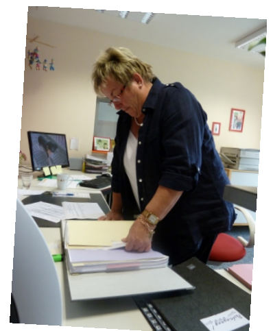
... Akten, Akten, Akten.