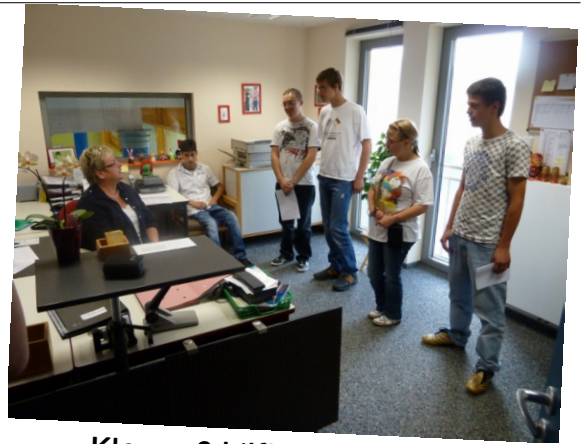
Klasse 9 hilft der Redaktion.